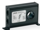
Steca PA HS200 Shunt